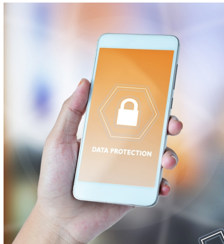
Wichtig: die eigenen Geräte schützen!

Es geht aber auch um den Einsatz neuer Technologien in Websites, zum Beispiel um Chatbots, die die Anbieter vermehrt in Internetauftritte einbinden, um unzureichende Verschlüsselung, die nicht dem Stand der Technik entspricht, um den Ausfall von Webseiten, da sie nicht belastbar genug sind,